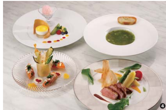
④ 『箱根・快適バスプラン』夕食イメージ(フランス料理)