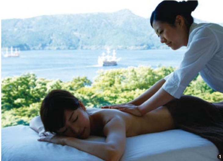
① 絶景スパ「スパ モンターニュ」