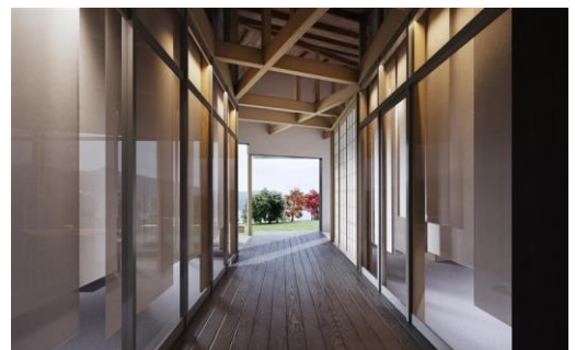
イメージパース 受付棟内観