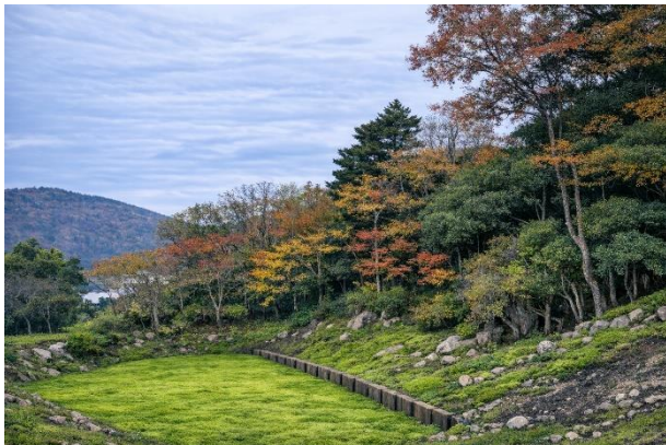
「見晴らしテラス」から見える景色（イメージ）

本計画は「森に佇む別邸」をコンセプトに、強羅の自然や起伏ある地形を生かして各棟を独立配置し、周囲を気にせず過ごせるプライベート性の高い滞在空間をつくとともに、和の建築様式や温泉を組み合わせることで、四季の移ろいや日本文化を感じられる体験を創出します。なお、小田急リゾートが運営するホテル「箱根 ゆとわ」の隣に位置しています。