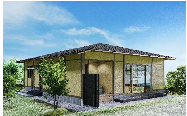
客室棟 外観（イメージ）