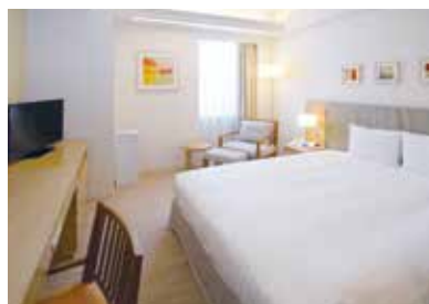
レディース エグゼクティブシングルルーム Ladies Executive Single Room

リゾート感あふれるアートワークや 家具に心癒されるふたりの空間 The artwork and furniture in our two-person rooms are overflowing with the charms of a resort hotel.