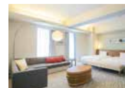
プレミアムツインルーム Premium Twin Room

ゆとりある160cm 幅のベッド マッサージチェアがある贅沢なひととき Enjoy some luxurious time to yourself with a spacious 160cm wide bed, or relax on the massage chair.