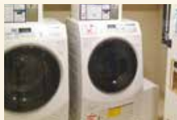
ランドリールーム Laundromat

加湿空気清浄機 設置 An air purifier and humidifier in each room