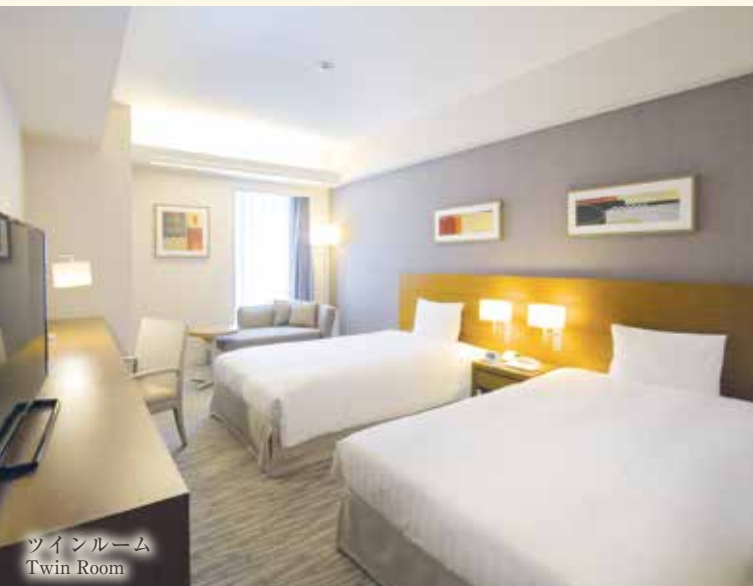
ツインルーム Twin Room