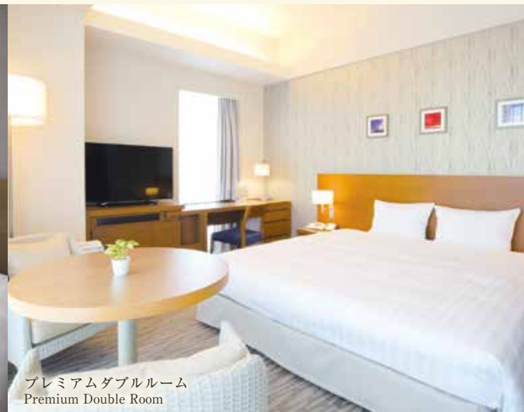
プレミアムダブルルーム Premium Double Room