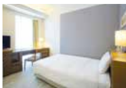
シングルルーム Single Room

Our upscale rooms are designed with your every comfort in mind. We welcome all of our guests warmly, and treat every one of our guests as a VIP, offering a class of hotel that is a rank above the rest.