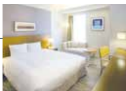
ダブルルーム Double Room

リゾート感あふれるアートワークや 家具に心癒されるふたりの空間 The artwork and furniture in our two-person rooms are overflowing with the charms of a resort hotel.