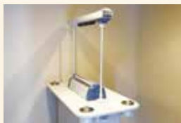
喫煙コーナー Smoking area