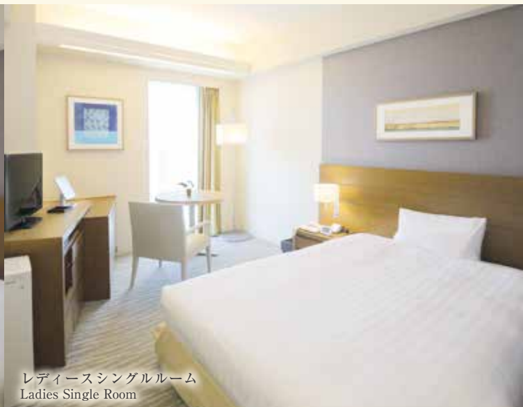
レディースシングルルーム Ladies Single Room