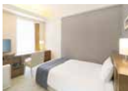
シングルルーム Single Room

Our upscale rooms are designed with your every comfort in mind. We welcome all of our guests warmly, and treat every one of our guests as a VIP, offering a class of hotel that is a rank above the rest.