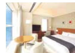
プレミアムダブルルーム Premium Double Room

高層階のお部屋の眼下に広がる ジオラマのような展望 High floor, panoramic view room with a king size bed.