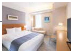
ダブルルーム Double Room

リゾート感あふれるアートワークや 家具に心癒されるふたりの空間 The artwork and furniture in our two-person rooms are overflowing with the charms of a resort hotel.