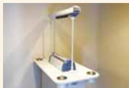
喫煙コーナー Smoking area