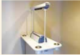
喫煙コーナー Smoking area