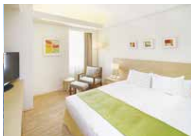
レディース エグゼクティブシングルルーム Ladies Executive Single Room

ビジネスニーズへの対応 ゆったりしたやすらぎを兼ね備えた客室 A guest room designed for the needs of business, which offers both comfort and tranquility