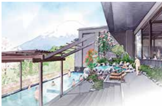
「木の花の湯」露天風呂(イメージ)