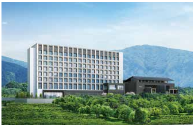
「HOTEL CLAD」および「木の花の湯」外観(イメージ)

名称はそれぞれ「HOTEL CLAD」(ホテル クラッド)、「木の花の湯」(このはなのゆ)とし、ロゴデザインも決定いたしました。