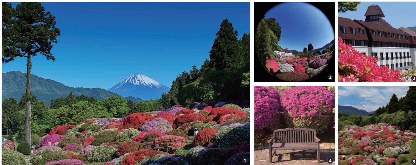
①庭園に咲くツツジと富士山 ②③ツツジ庭園とホテル外観 ④庭園内のフォトスポット ⑤ホテルから見た庭園