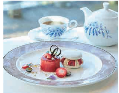
「Saison à colorier～彩る季節～」