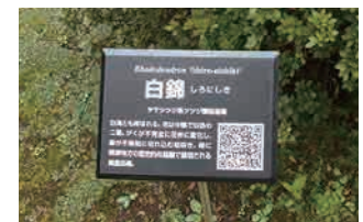
QRコード付き花看板