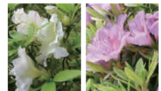
「白鳳殿」(左)と「紫琉球」(右)