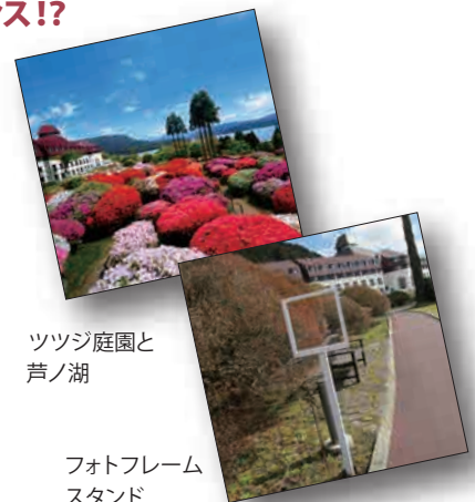
ツツジ庭園と 芦ノ湖

またホテルでは、今年新たに、庭園での撮影をさらに楽しくするためのアイテムを用意。庭園を知り尽くしたスタッフおすすめの撮影スポット2箇所に、「フォトフレームスタンド」を設置します。ここでシャッターを押せば間違いなし。カラフルなツツジと富士山など、絵画のように美しい風景を旅の思い出に残せます。