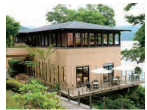
プレミアムショップ& サロン・ド・テロザージュ