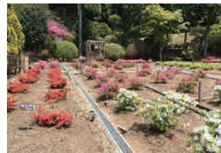
圃場で育成中のツツジ