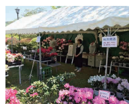
つつじ・しゃくなげフェアの様子