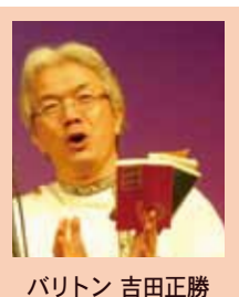
バリトン 吉田正勝